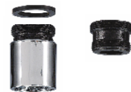
フィルター& スぺアダプター